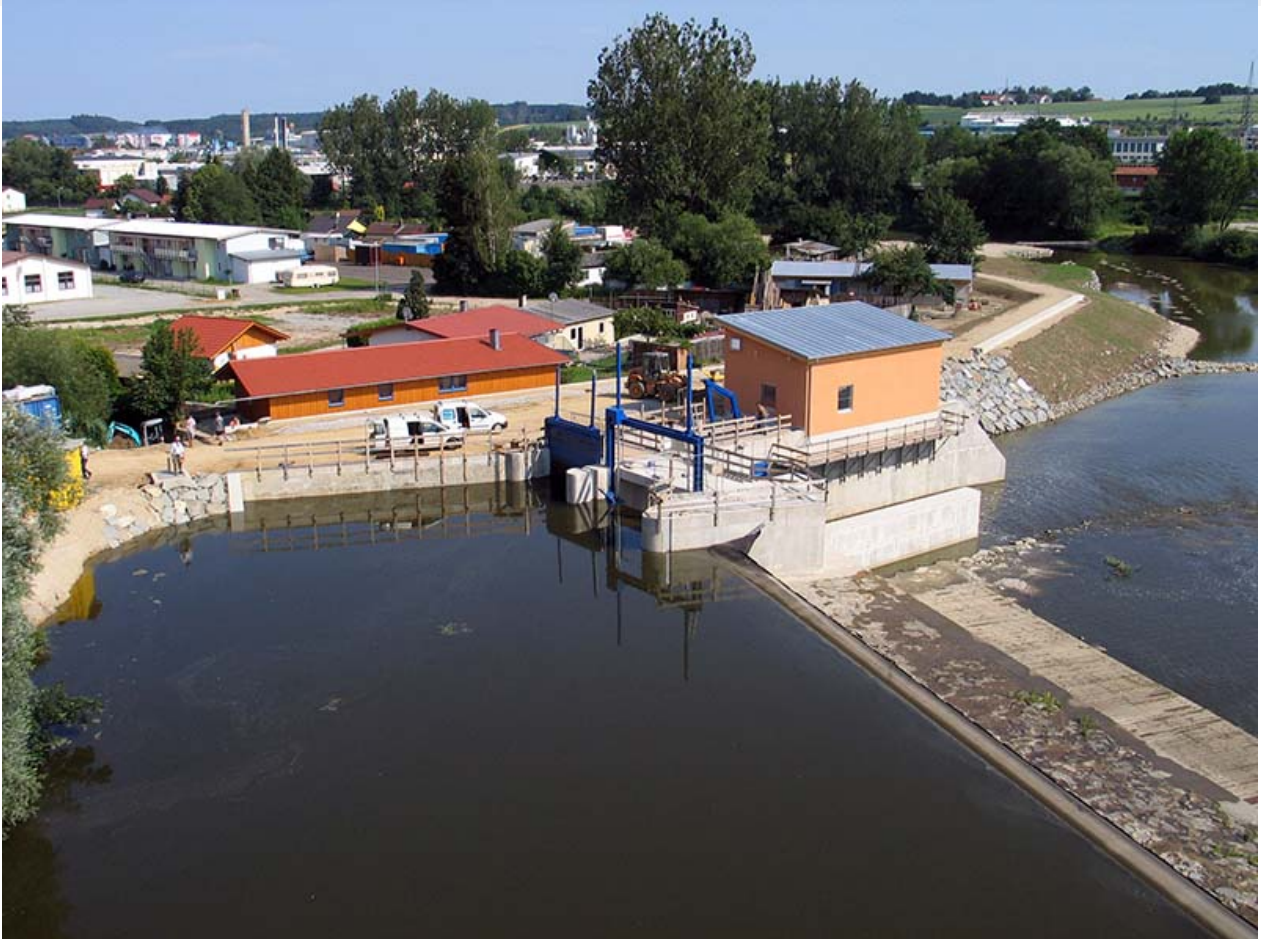
Oberwasser mit Wasserkraftanlage