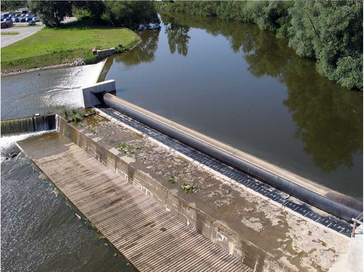
Mit dem Schlauchwehr wird der Hochwasserdurchfluss gesteuert