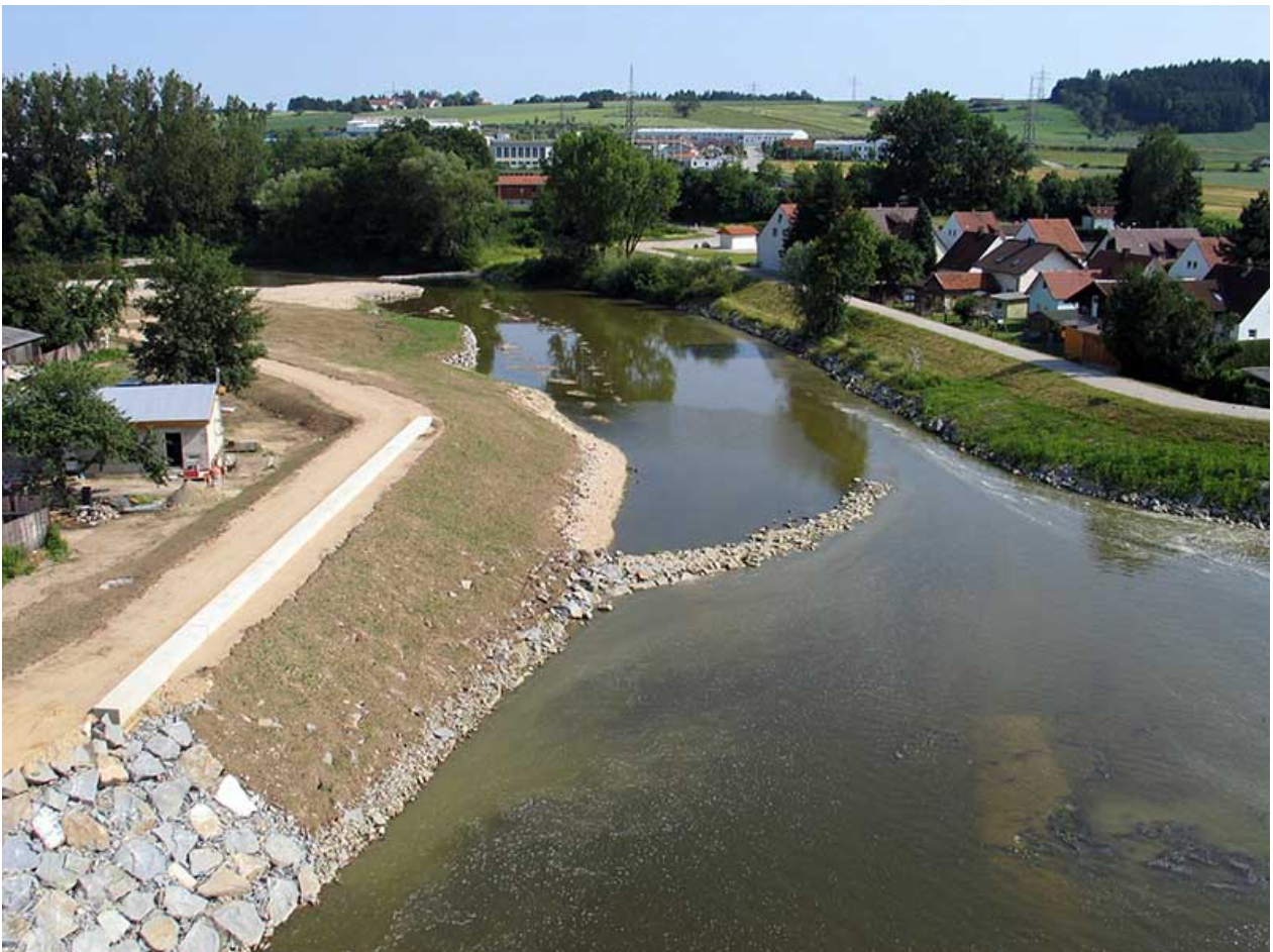
Unterwasser der Turbine mit Leitbühne