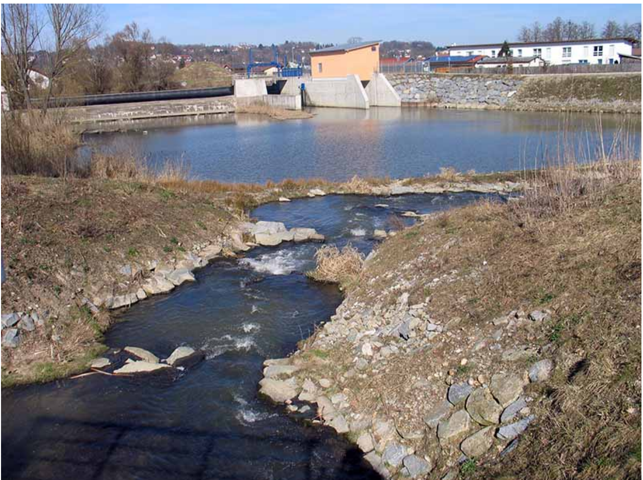
Bild oben und unten Fischtreppe